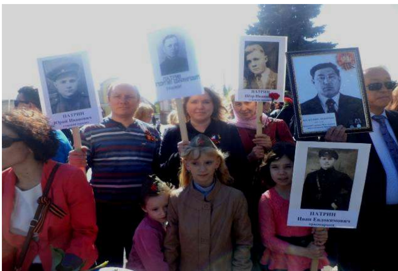
9 мая 2015 г. Участие автора в акции «Бессмертный полк».