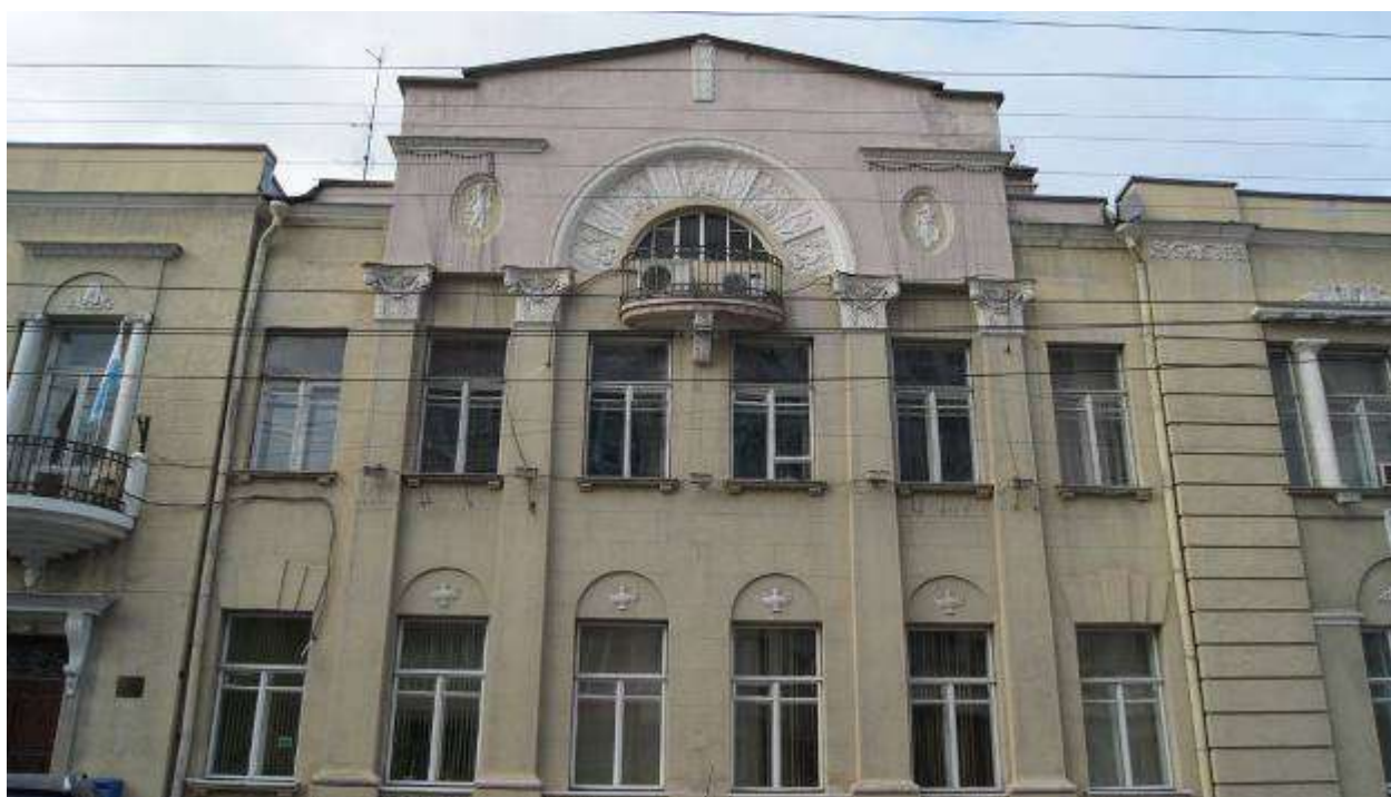
Приложение 10. Архитектура дома

А.И.Шумилина http://sadservie.ru/architecture/mansion/561 .