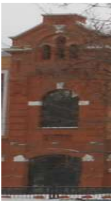
Приложение 6. Башня (часть зданий) торгового - развлекательного центра «Триумф - молла». 18.02.16.