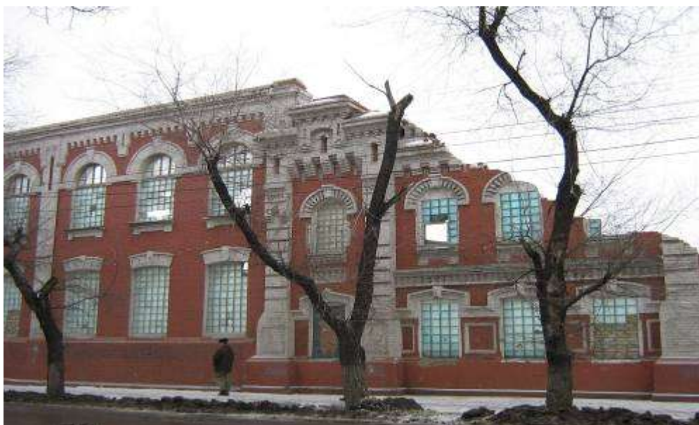
Приложение 3. Разрушенный маслобойный завод А.И.Шумилина 2000-е годы http://oldsaratov.ru/taxonomy/term/222/feed