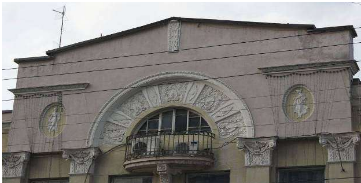
Приложение 9. Чердак дома

А.И.Шумилина http://sadservie.ru/architecture/mansion/561 .