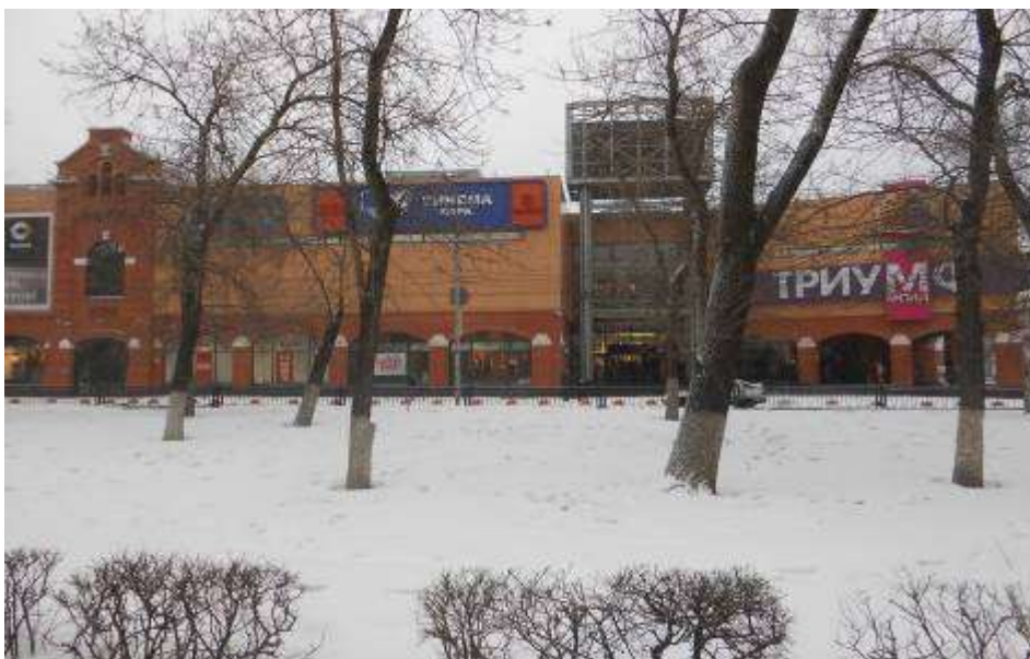
Приложение 5. Торгово-развлекательный центр «Триумф – молл». 18.02.16.